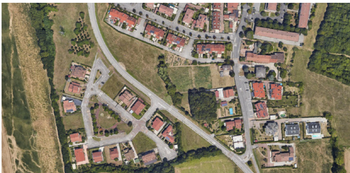
Immagine dell'area vasta di progetto

La superficie oggetto dell'intervento si dispiega su di un lotto di 4000 mq di superficie di proprietà di Interporto Padova SpA . La stessa è localizzata a sud della Zona industriale di Padova e più precisamente nella frazione di Granze di Camin all'incrocio tra via Messico e Borgo Borghetto.